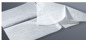
■ SEFAR MEDIFAB