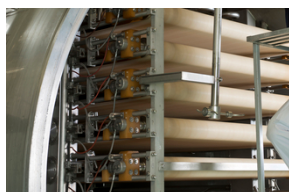
■ Новое слово в вакуумной сушке