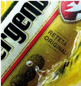
Cartazes iluminados com meios-tons acima de 30 linhas por centímetro com a SEFAR PET 1500

O rendimento da SEFAR PET 1500 impressiona em uma ampla variedade de aplicações, que vão desde a serigrafia gráfica de tamanhos pequenos e grandes (como cartazes, visores e sinalizações), impressões sobre plástico (como artigos esportivos, embalagens termoformadas, etc.), até a decoração em cerâmica, direta ou indiretamente, e a impressão em tecidos e outras impressões industriais.