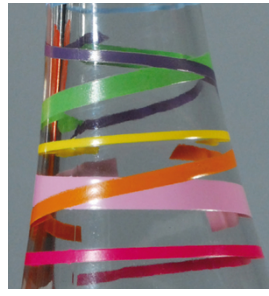
Alta densidade e contornos nítidos com a SEFAR PA