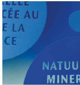
Cores brilhantes e bordas de impressão nítidas com tintas UV. Impresso com SEFAR PCF 120/305-34Y