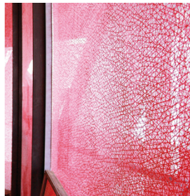
Para uma imagem de impressão precisa e durável na fachada de vidro, com SEFAR GLASSLINE 68/175-95W