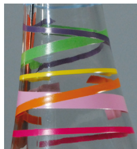
Alta densidade e contornos nítidos com a SEFAR PA