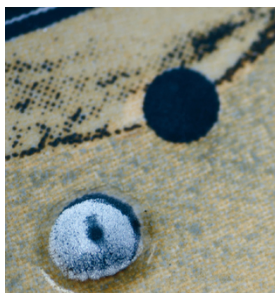
Ladrilhos estruturados e altamente resistentes com a SEFAR PA