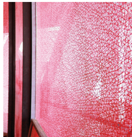
Para uma imagem de impressão precisa e durável na fachada de vidro, com SEFAR GLASSLINE 68/175-95W