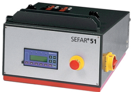
Unidade de controle eletrônico de circuito simples ou duplo programável com SEFAR 3A

Existem duas possibilidades para a conexão de ar aos sistemas pneumáticos de tensionamento: Sistemas de circuito simples ou duplo – alternativas complementares para a tensão ideal e equilibrada em todos os tipos de malha e todos os tamanhos de quadros. Os sistemas de circuito simples são recomendados para quadros com comprimentos laterais de até 150 cm. Para quadros com laterais superiores a 150 cm são recomendados sistemas de circuito duplo.