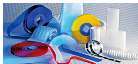
■ Fabricados especifica- mente para o cliente

Para mais informações e amostras de tecidos, selecione a opção de contato preferida à direita.