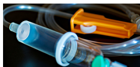
■ Filtros de Infusão