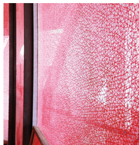
Para uma imagem de impressão precisa e durável na fachada de vidro, com SEFAR GLASSLINE 68/175-95W