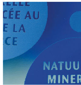
Cores brilhantes e bordas de impressão nítidas com tintas UV. Impresso com SEFAR PCF 120/305-34Y