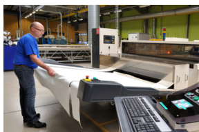
Cobertura para a indústria