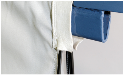
Design de vedação ideal