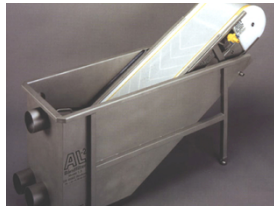
Esteira de filtros hidrostática