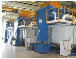
Esteira de filtros de pressão