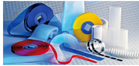
➤ Fabricados especifica- mente para o cliente

Para mais informações e amostras de tecidos, selecione a opção de contato preferida à direita.