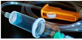
➤ Filtros de Infusão