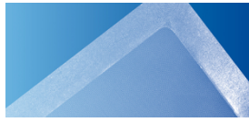
➤ Tratamento de feridas