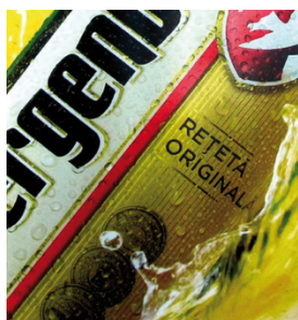
Posters retroilluminati con retinature superiori a 30 linee/cm stampati

SEFAR PET 1500 stupisce per le sue prestazioni in un'ampia varietà di applicazioni. Dalla grafica di piccolo e grande formato, come posters, espositori, e segnaletica, alla stampa di materie plastiche come articoli sportivi, componenti termoformati ecc.; dalla decorazione diretta e indiretta di ceramica fino alla stampa tessile e ad altri impieghi nella stampa industriale.