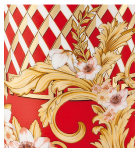
Ottima riproduzione di dettaglio su decalcomania ceramiche (© Rosenthal)