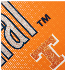
Bordi nitidi e testo ben leggibile su etichette stampate con SEFAR PCF FC