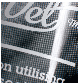
Qualità di stampa eccezionale di retinature fini su tubetti di plastica con SEFAR PCF FC

Estendi le tue possibilità di stampa serigrafica con SEFAR PCF su contenitori di plastica, etichette, vetreria, dischi ottici e molti altri supporti di stampa esigenti.