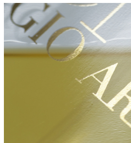
Caratteri ad alta intensità e dai bordi nitidi su flacone di profumo con SEFAR PCF FC

Video SEFAR PCF FC istruzioni di lavorazione