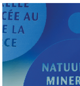
Colori brillanti e bordi nitidi con inchiostri UV. Stampato con SEFAR PCF 120/305-34Y