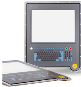
Caratteri e leggende nitidi e durevoli stampati con SEFAR PME