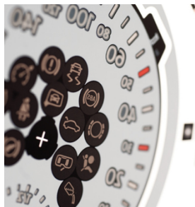
All'avanguardia per il più alto grado di efficienza e qualità stampando con SEFAR PME