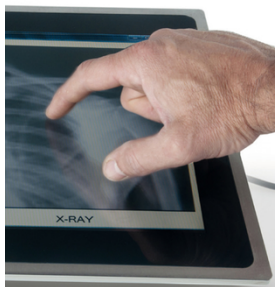
Maschere dei bordi o vernici protettive stampate con SEFAR PME