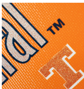
Bordi nitidi e testo ben leggibile su etichette stampate con SEFAR PCF FC