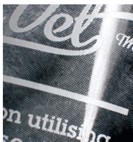
Qualità di stampa eccezionale di retinature fini su tubetti di plastica con SEFAR PCF FC

Estendi le tue possibilità di stampa serigrafica con SEFAR PCF su contenitori di plastica, etichette, vetreria, dischi ottici e molti altri supporti di stampa esigenti.