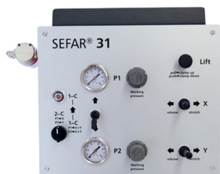
La centralina di controllo universale, ergonomica e compatta abbinata a SEFAR 3Ai