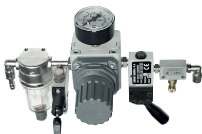
La centralina di controllo semplice abbinata a SEFAR 3Ai