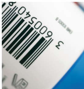
Codici a barre ad alta risoluzione con dettagli definiti e nitidi con SEFAR PA