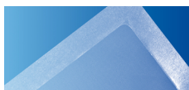
■ Trattamento delle ferite