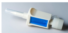
■ Sistemi di ventilazione