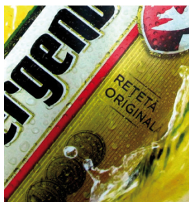
Affiches rétro-éclairées avec des trames de plus de 30 lignes/cm

Le SEFAR PET 1500 impressionne par ses performances dans une grande variété d'applications, dont la sérigraphie graphique petit et grand format – affiches, panneaux, et signalétique; l'impression sur plastique – articles de sport, pièces thermoformées etc.; la décoration céramique directe ou indirecte, l'impression textile, et les travaux d'impression industriels.