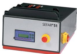
L'unité de commande électronique simple ou double circuit programmable

En matière de systèmes de tension pneumatiques il existe deux possibilités d'alimentation en air comprimé: les systèmes à circuit simple ou double – deux possibilités complémentaires pour obtenir des tensions optimales et équilibrées avec tous types de tissu et de taille de cadre. Les systèmes à circuit simple sont recommandés pour des cadres ayant des côtés jusqu'à 150 cm. Au delà de 150 cm les systèmes a double circuit sont recommandés.