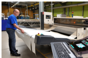
Housses de secteur