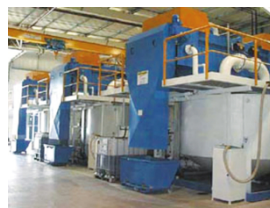
Filtres à bande sous pression