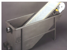
Filtres à bande hydrostatiques