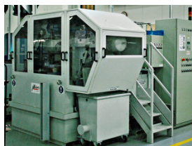
Filtres à bande sous vide