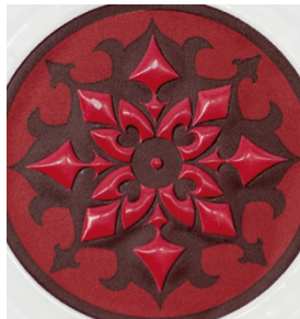
Para lograr exclusivos barnices transparentes en etiquetas impresas con SEFAR PET 1500