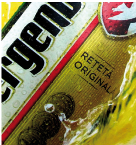
Impresión de carteles retroiluminados con semitonos de más de 30 líneas/cm con SEFAR PET 1500

El rendimiento de SEFAR PET 1500 es impresionante en una amplia variedad de aplicaciones, que van desde la serigrafía gráfica de tamaños grandes o pequeños (como carteles, visores y señalizaciones), impresiones sobre plásticos (como en artículos deportivos, piezas termoformadas, etc.) a la decoración de cerámicas, directa o indirecta, así como en impresiones de tejidos y otras tareas de impresión industrial.