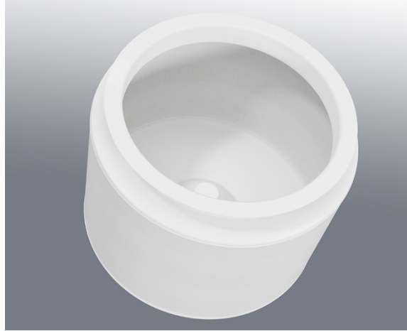
Centrífuga de eje vertical