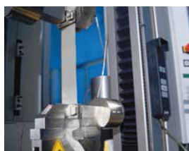
Las bandas de Sefar