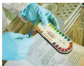
Las bandas filtro Sefar