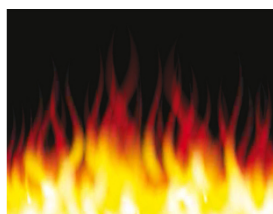
Las badas de Sefar