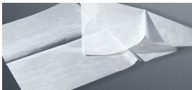
■ SEFAR MEDIFAB