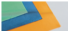
■ Otras aplicaciones