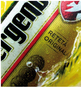
Plakat mit Hintergrundbeleuchtung – Raster feiner als 30 Linien/cm, gedruckt mit SEFAR PET 1500