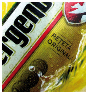
Plakat mit Hintergrundbeleuchtung – Raster feiner als 30 Linien/cm, gedruckt mit SEFAR PET 1500