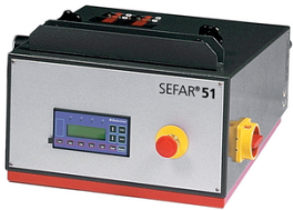
Das programmierbare elektronische Ein- oder Zweikreis-Steuergerät in Kombination mit SEFAR 3A

Für pneumatische Spannsysteme gibt es zwei Arten der Luftzufuhr: