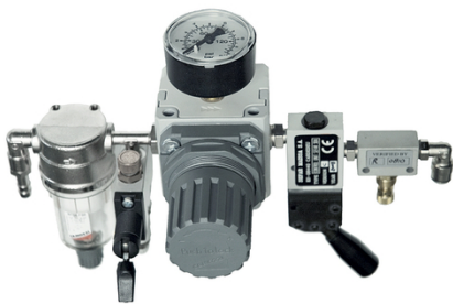
Das einfache Steuergerät in Kombination mit SEFAR 3A