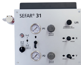
Universelles, ergonomisches und kompaktes Steuergerät in Kombination mit SEFAR 3A