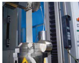
Sefar-Bänder sind für