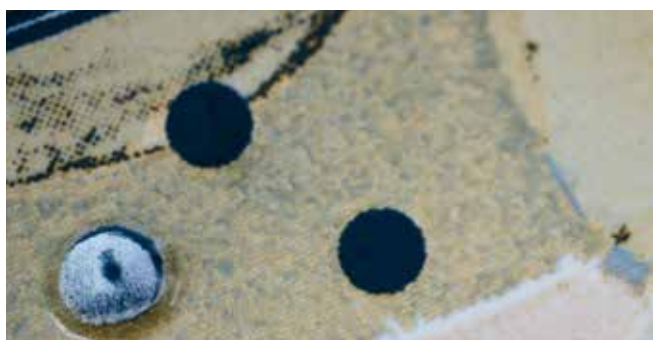
Azulejos de chão estruturados e altamente resistentes, com SEFAR® PA 61/155-60W

SEFAR® PA é adequada para aplicações que requerem o uso de tintas altamente abrasivas e onde a matriz tem que se adequar à forma dos substratos: Por exemplo, a impressão em azulejos, recipientes de plástico ou de vidro.