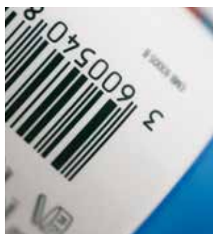
Códigos de barras impressos em alta densidade e nitidez, com SEFAR® PA 140/355-30Y