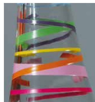
Alta densidade e contornos nítidos, com SEFAR® PA 100/255-38Y