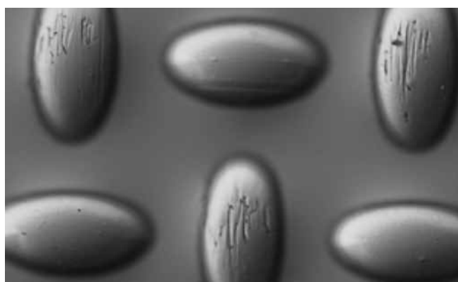
Malha de poliéster padrão 120/305-34W após 5.000 impressões