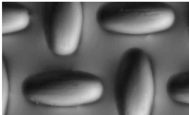
SEFAR® PA 120/305-35W depois de 5.000 impressões

As propriedades da SEFAR® PA não deixam desejos sem resposta: alta elasticidade, excelente resistência à abrasão, muito boa adesão do material da matriz e – em amarelo – inigualável proteção dos efeitos da luz UV.