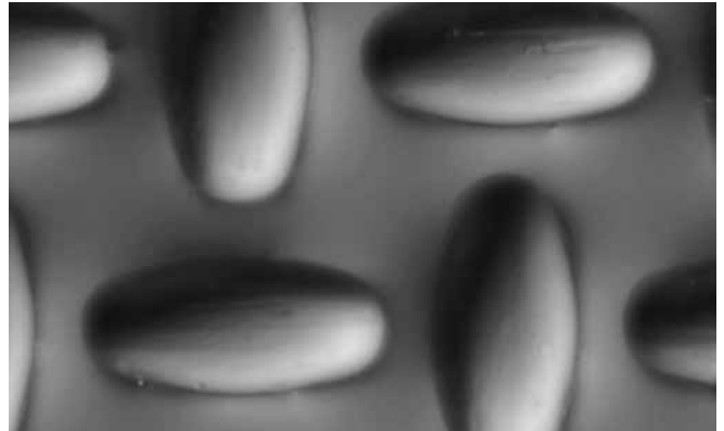
SEFAR® PA 120/305-35W après 5 000 impressions

Les propriétés de SEFAR® PA ne laissent aucun désir sans réponse : Grande élasticité; excellente résistance à l'abrasion; très bonne adhérence du pochoir et – en jaune – une protection inégalée contre la perte de précision à l'insolation.